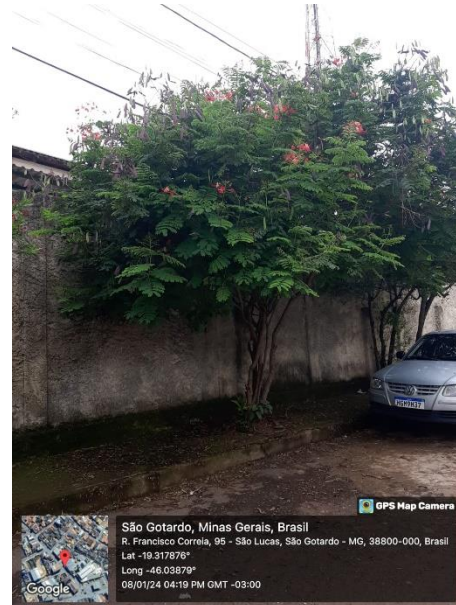
Figura 04: Flamboyant mirim ( Lagerstroemia indica ).