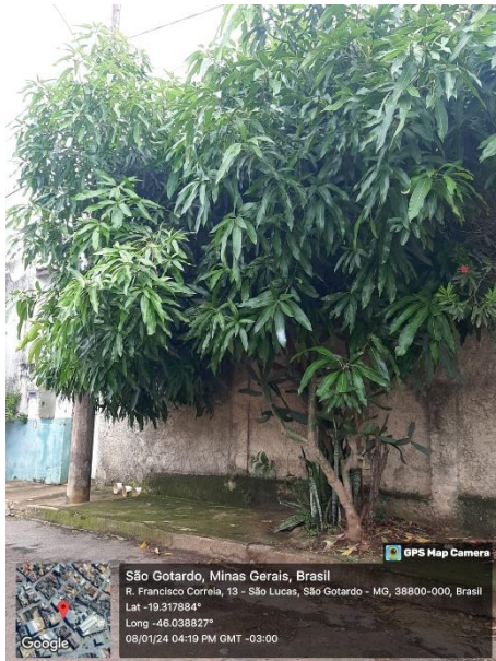
Figura 03: Espécie Mangueira ( Lagerstroemia indica ).