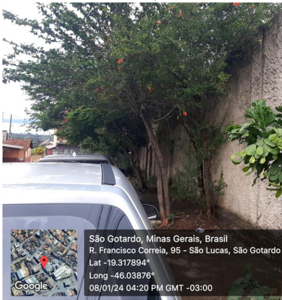
Figura 01: Espécie Romã ( Lagerstroemia indica ).

Segue o registro fotográfico no momento da vistoria.